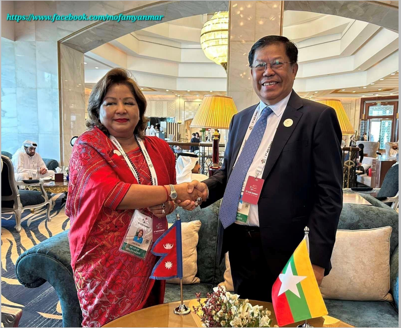
ဒုတိယဝန်ကြီးချုပ်နှင့် နိုင်ငံခြားရေးဝန်ကြီးဌာန၊ ပြည်ထောင်စုဝန်ကြီး ဦးသန်းဆွေသည် နီပေါနိုင်ငံ၊ နိုင်ငံခြားရေးဝန်ကြီး ဒေါက်တာ အာဇူရာနာဒူဘာနှင့် တွေ့ဆုံစဉ်။