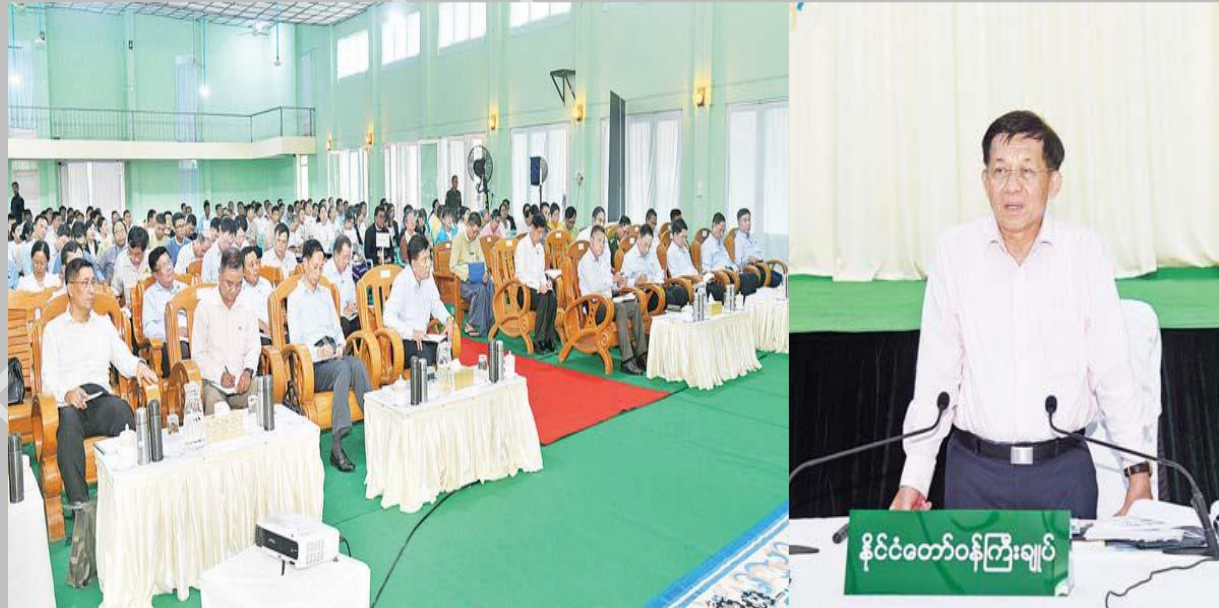
နိုင်ငံတော်စီမံအုပ်ချုပ်ရေးကောင်စီဥက္ကဋ္ဌ နိုင်ငံတော်ဝန်ကြီးချုပ် ဗိုလ်ချုပ်မှူးကြီး မင်းအောင်လှိုင် မိတ္ထီလာခရိုင်အတွင်းရှိ ဌာနဆိုင်ရာတာဝန်ရှိသူများ၊ မြို့မိမြို့ဖများ အား တွေ့ဆုံ၍ ဒေသစီးပွားဖွံ့ဖြိုးတိုးတက်ရေးဆိုင်ရာများ ဆွေးနွေးပြောကြားစဉ်။

မိမိတို့အနေဖြင့် မိတ္ထီလာခရိုင် ဖွံ့ဖြိုးတိုးတက်ရေး မျှော်မှန်းဆောင်ရွက်လျက်ရှိ ကြောင်း၊ ထိုသို့ဆောင်ရွက်ရာတွင် သာမန်ဆောင်ရွက်နေခြင်းမျိုးမဟုတ်ဘဲ အားထည့်၍ ဆောင်ရွက်သွားရန်လိုအပ်ပြီး အချိန်ကိုအကျိုးရှိစွာဖြင့် အသုံးပြုကြစေလိုကြောင်း၊ မိမိတို့ဒေသ ဖွံ့ဖြိုးတိုးတက်ရေးအတွက် ဒေသတွင်တာဝန်ထမ်းဆောင်နေကြသူများ၊ ဒေသခံများအားလုံးက အမြင်ကျယ်ကျယ်ဖြင့် အတူတကွ ဝိုင်းဝန်းကြိုးပမ်းဆောင်ရွက်သွားကြရန် တိုက်တွန်းပြောကြား ခဲ့ပါသည်။