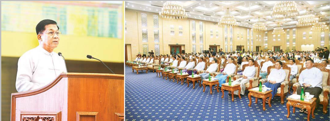
နိုင်ငံတော်စီမံအုပ်ချုပ်ရေးကောင်စီဥက္ကဋ္ဌ နိုင်ငံတော်ဝန်ကြီးချုပ် ဗိုလ်ချုပ်မှူးကြီး မင်းအောင်လှိုင် ၂၀၂၄ ခုနှစ် ကမ္ဘာ့ခရီးသွားလုပ်ငန်း အထိမ်းအမှတ်အခမ်းအနား တက်ရောက်အမှာစကားပြောကြားစဉ်။

“ခရီးသွားနှင့် ငြိမ်းချမ်းရေး လက်တွဲတူယှဉ် ဖော်ဆောင်ပေး” ဟူသည့် ၂၀၂၄ ခုနှစ် ၊ ကမ္ဘာ့ခရီးသွားလုပ်ငန်းနေ့ အထိမ်းအမှတ်ဆောင်ပုဒ်နှင့်အညီ မြန်မာနိုင်ငံ၏ အနာဂတ်ခရီးသွား လုပ်ငန်း ရေရှည်ဖွံ့ဖြိုးတိုးတက်စေရန်အတွက် ငြိမ်းချမ်းရေးလုပ်ငန်းစဉ်များကို ခရီးသွားလုပ်ငန်း ကဏ္ဍဆောင်ရွက်သူများအားလုံး နိုင်ငံတော်အစိုးရနှင့် ပူးပေါင်းပြီး တက်ညီလက်ညီ ပါဝင်ဆောင်ရွက် သွားကြရန် တိုက်တွန်းပြောကြားခဲ့ပါသည်။