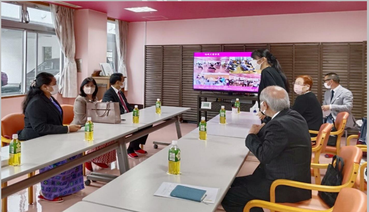
Sai no Kuni Health and Social Welfare Cooperative ကုမ္ပဏီ မှ တာဝန်ရှိသူများနှင့် တွေ့ဆုံ၍ လုပ်ငန်းခွင်နှင့်ပတ်သက်၍ ဆွေးနွေးပြောကြားစဉ်။