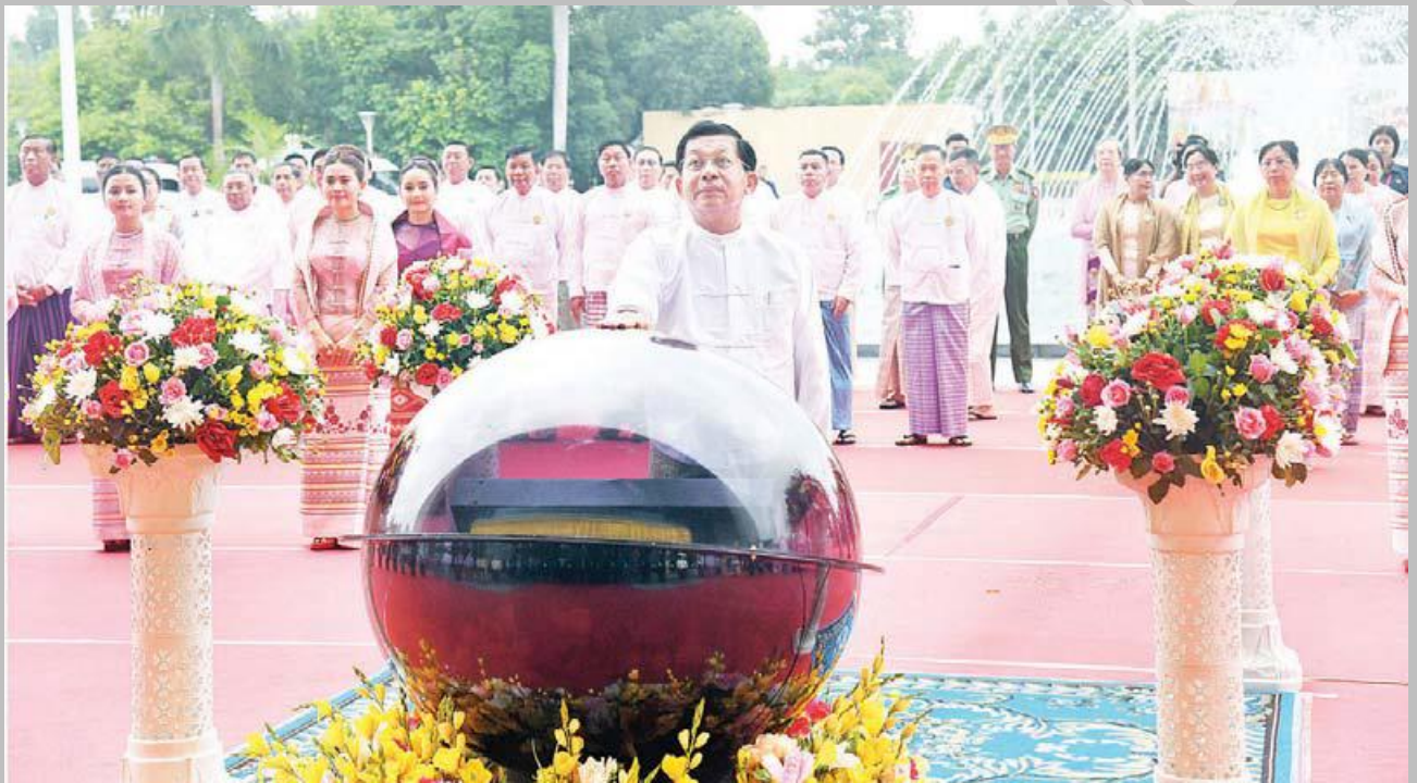
နိုင်ငံတော်စီမံအုပ်ချုပ်ရေးကောင်စီဥက္ကဋ္ဌ နိုင်ငံတော်ဝန်ကြီးချုပ် ဗိုလ်ချုပ်မှူးကြီး မင်းအောင်လှိုင် (၂၅)ကြိမ်မြောက် ငွေရတုအထိမ်းအမှတ် မြန်မာ့ရိုးရာယဉ်ကျေးမှု အဆို၊ အက၊ အရေး၊ အတီး ပြိုင်ပွဲ ဆိုင်းဘုတ်အား စက်ခလုတ်နှိပ်၍ ဖွင့်လှစ်ပေးစဉ်။

ကိုယ်ပိုင်အမျိုးသားရေး စရိုက်လက္ခဏာများ တင့်တင့်တယ်တယ် ဆက်လက်ရှင်သန် ဖြစ်ထွန်း နေရစေရေး အနုပညာစွမ်းပကားနှင့် စွမ်းဆောင်ပေးကြရန်၊ မြန်မာလူမျိုးတို့၏ သမိုင်းကြောင်း ခိုင်မာနက်ရှိုင်းမှုနှင့် ယဉ်ကျေးမှုအဆင့်အတန်း ဝင့်ထည်မြင့်မားမှုတို့ကို ကမ္ဘာတည်သရွေ့ တည်တံ့ခိုင်မြဲနေအောင် အနုပညာစွမ်းပကားဖြင့် စွမ်းဆောင်ပေးကြရန်၊ မျိုးဆက်သစ် လူငယ်များကို အမျိုးသားရေးစိတ်ဓာတ် ကိုယ်ခံအားပြည့်ဝခိုင်မာအောင် အနုပညာစွမ်းပကားဖြင့် စွမ်းဆောင် ပေးကြရန် တိုက်တွန်းပြောကြားလိုကြောင်း စသည်ဖြင့် ပြောကြားခဲ့ပါသည်။