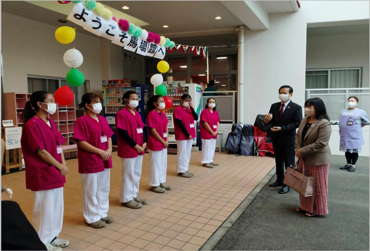
မြန်မာသံအမတ်ကြီး ဦးစိုးဟန်မှ Yoshinosato Group ကုမ္ပဏီမှ ခန့်အပ်ထားသည့် မြန်မာဝန်ထမ်းများနှင့်တွေ့ဆုံစဉ်။