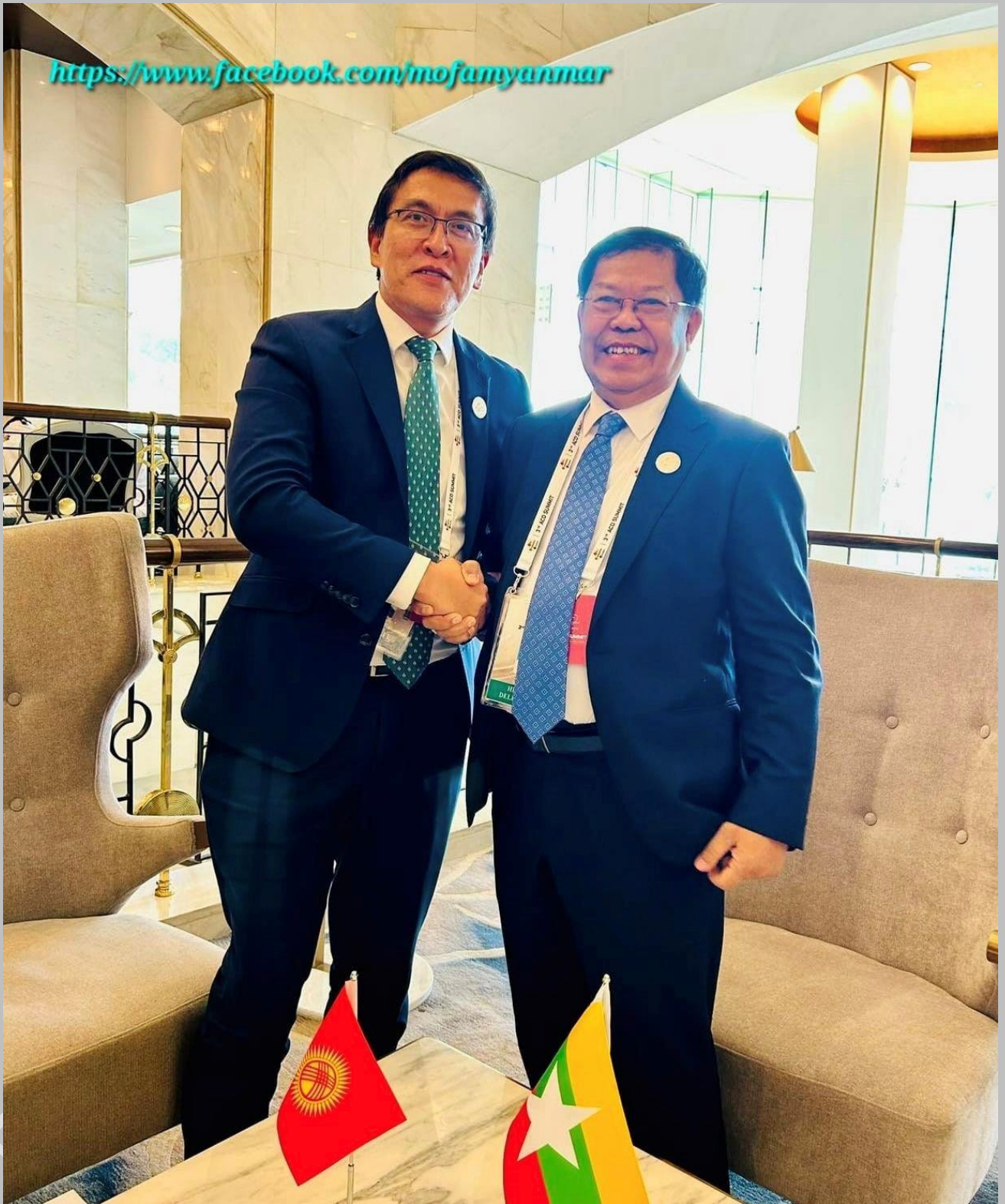
ဒုတိယဝန်ကြီးချုပ်နှင့် နိုင်ငံခြားရေးဝန်ကြီးဌာန၊ ပြည်ထောင်စုဝန်ကြီး ဦးသန်းဆွေသည် ကာဂျစ်သမ္မတနိုင်ငံ၊ ဒုတိယဝန်ကြီးချုပ် မစ္စတာအီဒေးဘိုင်ဆလော့စ်နှင့် တွေ့ဆုံစဉ်။