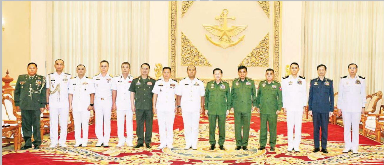
နိုင်ငံတော်စီမံအုပ်ချုပ်ရေးကောင်စီဥက္ကဋ္ဌ တပ်မတော်ကာကွယ်ရေးဦးစီးချုပ် ဗိုလ်ချုပ်မှူးကြီး မင်းအောင်လှိုင်နှင့်အဖွဲ့ဝင်များ (၁၈)ကြိမ်မြောက် အာဆီယံရေတပ်ဦးစီးချုပ်များ အစည်းအဝေးသို့ တက်ရောက်မည့် အာဆီယံရေတပ်အကြီးအကဲများနှင့် ကိုယ်စားလှယ်အဖွဲ့ခေါင်းဆောင်များနှင့်အတူ စုပေါင်းဓာတ်ပုံရိုက်စဉ်။

ယင်းနောက် တက်ရောက်လာကြသည့် အာဆီယံ ရေတပ်အကြီးအကဲများနှင့် ကိုယ်စားလှယ်အဖွဲ့ ခေါင်းဆောင်များက နိုင်ငံအလိုက် တစ်ဦးချင်းမိတ်ဆက်ကြပြီး အစည်းအဝေးလာရောက်စဉ်နှင့် မြန်မာနိုင်ငံသို့ ရောက်ရှိနေစဉ်အတွင်း မြန်မာနိုင်ငံအနေဖြင့် ဧည့်ဝတ်ကျော့ပွန်စွာဖြင့် စီစဉ်ဆောင်ရွက်ပေးမှုအခြေအနေများ၊ (၁၈)ကြိမ်မြောက် အာဆီယံ ရေတပ်ဦးစီးချုပ်များ အစည်းအဝေး ကျင်းပပြုလုပ်သွားမည့် အခြေအနေများ၊ မြန်မာနိုင်ငံနှင့် အာဆီယံရေတပ်များအချင်းချင်း ပူးပေါင်းဆောင်ရွက်မှုများ ဆက်လက်မြှင့်တင် ဆောင်ရွက်သွားမည့် အခြေအနေများနှင့်ပတ်သက်၍ ဆွေးနွေး ပြောကြားခဲ့ပါသည်။