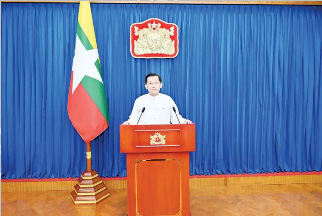
နိုင်ငံတော်စီမံအုပ်ချုပ်ရေးကောင်စီဥက္ကဋ္ဌ နိုင်ငံတော်ဝန်ကြီးချုပ် ဗိုလ်ချုပ်မှူးကြီး မင်းအောင်လှိုင် ၂၀၂၄ ခုနှစ် လူဦးရေနှင့်အိမ်အကြောင်းအရာ သန်းခေါင်စာရင်း ကောက်ယူခြင်းအထိမ်းအမှတ် ပြည်သူ့သို့ မိန့်ခွန်းပြောကြား

၂၀၂၄ ခုနှစ်၊ အောက်တိုဘာလ ၁ ရက်နေ့မှ ၁၅ ရက်နေ့အထိ လူဦးရေနှင့် အိမ်အကြောင်း သန်းခေါင်စာရင်း ကောက်ယူမည့်လုပ်ငန်းစဉ်ကြီးတွင် နိုင်ငံတစ်ဝန်း နိုင်ငံသူ နိုင်ငံသား၊ တိုင်းရင်းသား ညီအစ်ကိုမောင်နှမများအားလုံး၏ ညီညွတ်သောအင်အားဖြင့် အောင်မြင်အောင် ဆောင်ရွက်ပြီး တစ်နည်းအားဖြင့် တိုင်းရင်းသားပြည်သူတစ်ရပ်လုံး၏ပူးပေါင်းပါဝင်မှုအားဖြင့် သမိုင်း မှတ်တိုင်တစ်ခု စိုက်ထူနိုင်မည့် အခွင့်အခါကောင်းတစ်ရပ်လည်းဖြစ်ပါသည်။ ထို့ကြောင့် သန်းခေါင်စာရင်းလုပ်ငန်း စဉ်ကြီးကို နိုင်ငံတော်၏ အမျိုးသားလုပ်ငန်းစဉ်အဖြစ် ခံယူပြီး “ပြည်သူ့အားလုံးပါဝင်လို့၊ သန်းခေါင် စာရင်းကောက်ကြစို့” ဆိုသည့် ဆောင်ပုဒ်နှင့်အညီ တိုင်းရင်းသားပြည်သူတစ်ရပ်လုံးမှ အင်တိုက် အားတိုက် ပူးပေါင်းပါဝင်ဆောင်ရွက်ကြပါဟု တိုက်တွန်းပြောကြားခဲ့ပါသည်။